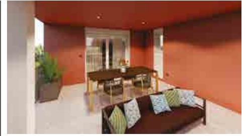
S. V. I. 0546 29379 FAENZA / ADIACENTE CENTRO

Appartamento di nuova costruzione posto al piano primo, composto da ingresso, soggiorno con cucina a vista, due bagni, loggia coperta, due c. letto. Possibilità di cantina e autorimessa.