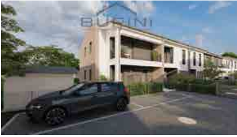
BURINI 0546 668423 FAENZA / VIA FRATELLI ROSSELLI

Trilocale in corso di costruzione: app. al p.1° ed ultimo, con sala, cucina open space, disimpegno, 2 camere, bagno finestrato, terrazzo ed al piano terra garage e 2 posti auto. Possibilità di personalizzare gli spazi interni e le finiture! Consegna marzo 2027. Cl. En. Di progetto A. Eur. 228.000,00