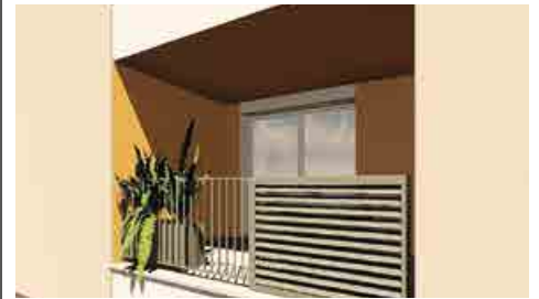
IL LABIRINTO 0546 26805 FAENZA / ZONA FILANDA

In zona strategica vicino ai servizi e alle principali vie di raccordo, in nuovo complesso di prossima realizzazione, appartamento posto al secondo piano con ascensore composto da: ingresso, zona giorno con affaccio su loggia di oltre mq. 10, due camere, due bagni, Possibilità di acquisto di garage o posto auto e cantina. Cl. En. di progetto A4.