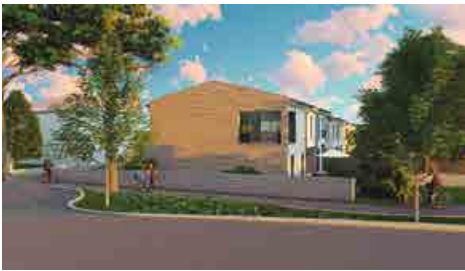
S. V. I. 0546 29379 FAENZA / ZONA BORGO

Prossima realizzazione. Appartamento al primo piano. Un posto auto di proprietà. Possibilità di personalizzazioni interne. Consegna 2026.