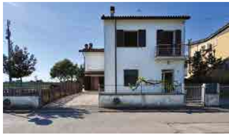
SARA' CASA 0545 1772411 ALFONSINE / SEMICENTRALE

Casa indipendente sviluppata su due livelli e con ampi spazi abitativi. Completa di giardino privato di 280 mq, garage e servizi. Soluzione ideale per famiglie numerose o per chi desidera indipendenza. C.E. "G" EP tot = 417,76 kWh/m²anno.