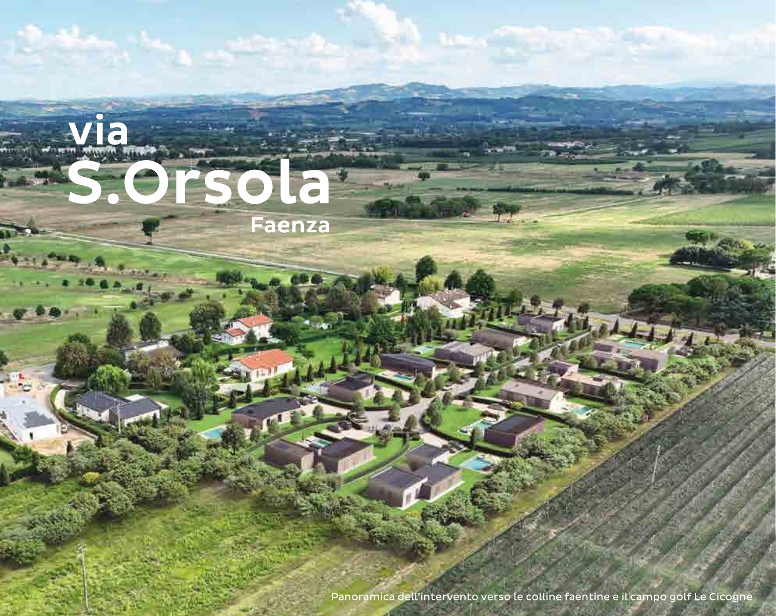
Panoramica dell'intervento verso le colline faentine e il campo golf Le Cicogne