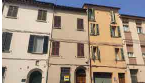
GABETTI 0546 22730 FAENZA / AD.ZE PIAZZA VIA BONDILO

Trilocale in corso di costruzione: app. al p.1° ed ultimo, con sala, cucina open space, disimpegno, 2 camere, bagno finestrato, terrazzo ed al piano terra garage e 2 posti auto. Possibilità di personalizzare gli spazi interni e le finiture! Consegna marzo 2027. Cl. En. Di progetto A. Eur. 228.000,00